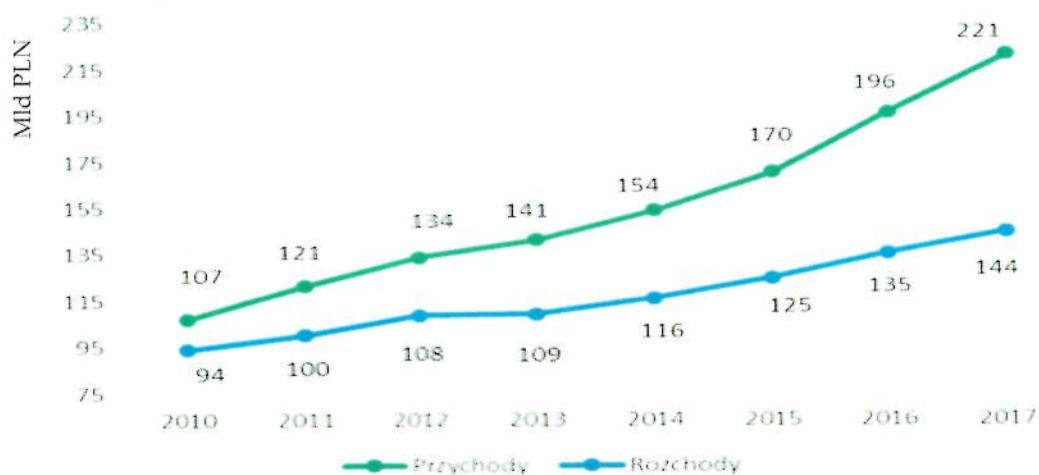
Wykres 2: Obroty w międzynarodowym handlu usługami.

Tradycyjnie największy wpływ na kształtowanie się wielkości przychodów miały pozostałe usługi, usługi transportowe i podróże zagraniczne. Wpływy z eksportu pozostałych usług w 2017 r. wyniosły aż 90,6 mld PLN, co w porównaniu do poprzedniego roku oznacza wzrost o 13,8%. Omawiany przyrost spowodowany był po raz kolejny przez zwiększenie eksportu pozostałych usług biznesowych (o 6,2 mld PLN