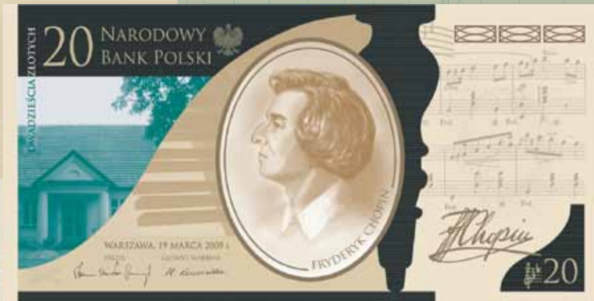
Banknot kolekcjonerski wydany z okazji 200. rocznicy urodzin Fryderyka Chopina